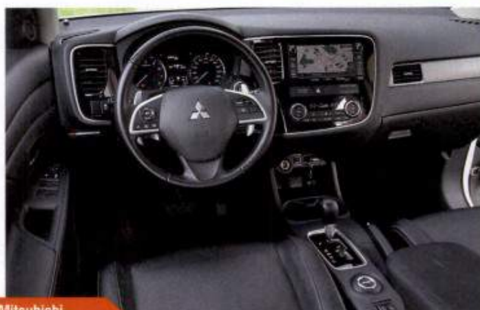
Mitsubishi Outlander 2.4 AWD

▲ В салоне никаких видимых перемен. Так и не подсвечена мелочовка слева от руля, так и не отредактированы огрехи русификации. Но отличия можно... услышать! Шумоизоляция-то доработана